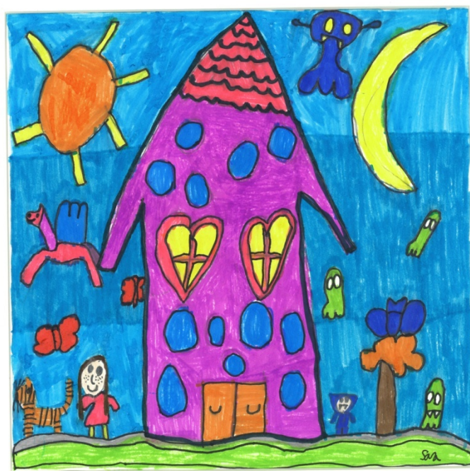
Hus - Sara Torsdatter Uv