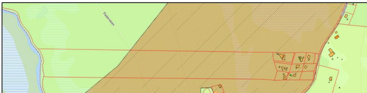
Planområdet i kommuneplanens arealdel

I kommuneplanens arealdel står følgende: «Salg av tomter og tjenester til fritidseiendomsmarkedet er en viktig næringsressurs for Rennebu. I samfunnsdelen står det: "Rennebu skal framstå som en attraktiv hyttekommune. Hyttenæringen skal videreutvikles som en næringsressurs for lokalsamfunnet. Utbyggingen må foregå i balanse med primærnæringenes utnyttelse av utmarksområdene"». Tiltaket er slik sett i tråd med ønsket om å tilrettelegge for hyttebygging i kommunen og de positive økonomiske ringvirkninger dette har både for grunneier og lokalsamfunn.