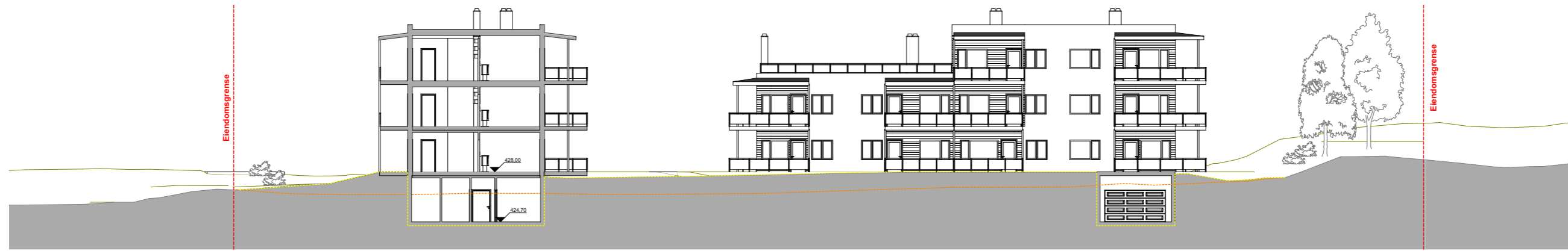
1:300 Snitt A