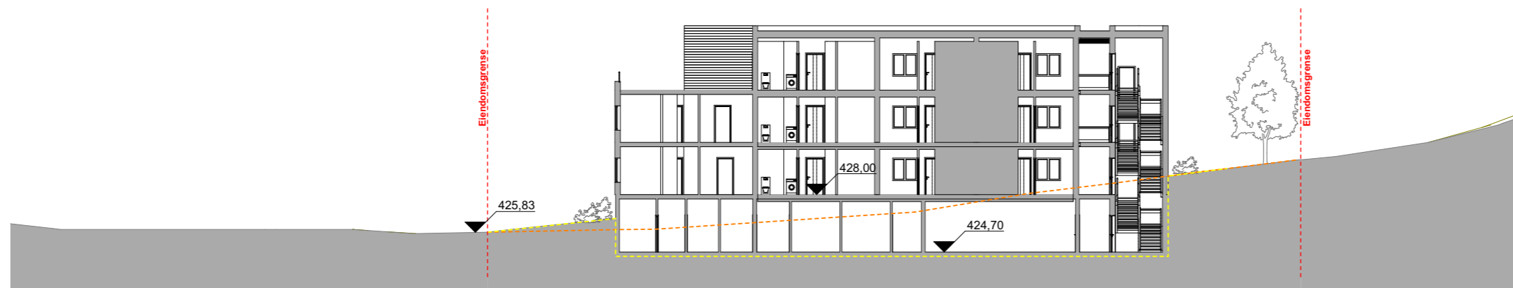
1:300 Snitt E