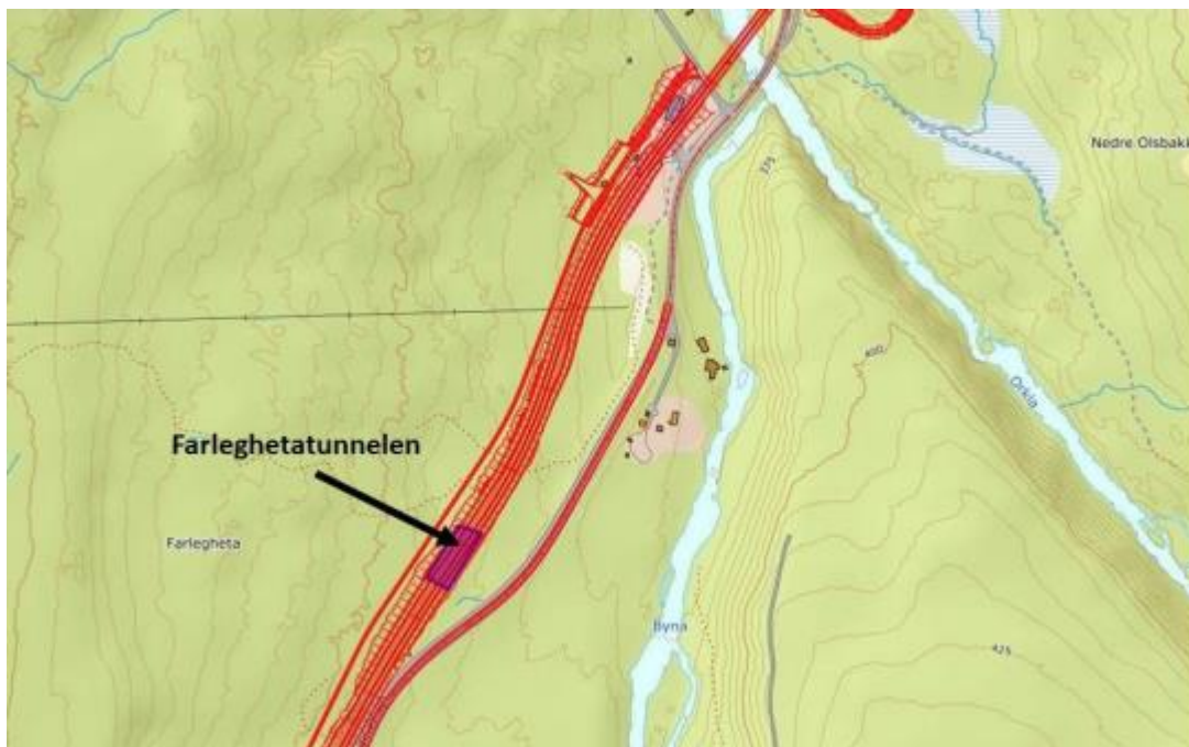
Farleghetatunnelen – tunnel over E6 som viltovergang i Førlegheta

Kopi SPRÅKRÅDET Ingebrigt Drivstuen, RENNEBU KOMMUNE Jan Olav Sivertsen, NYE VEIER AS